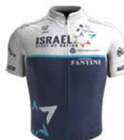
ISRAEL START-UP NATION