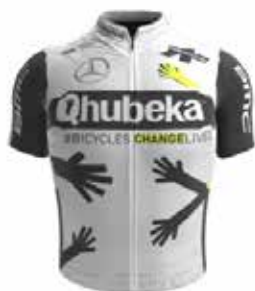
TEAM QHUBEKA ASSOS