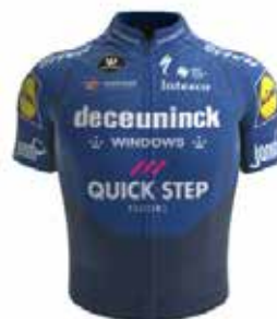
DECEUNINCK - QUICK-STEP