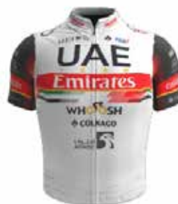
UAE TEAM EMIRATES