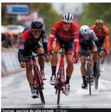
Tournai, capitale du vélo samedi.

Ce samedi 5 octobre, Tournai vibrera à nouveau pour le vélo, avec le peloton du 79e Eurométropole Tour, qui partira de La Louvière pour foncer vers les monts de Frasnies et finir à Tournai après 176,7 kilomètres. En lice, des coureurs de renom, dont le nouveau maillot arc-en-ciel Mads Pedersen, dernier vainqueur en date dans la cité des cinq Clochers, des motifs d'après-Mondiaux, provenant notamment des quatre équipes UCI worldteams alignées, à savoir Trek, AG2R, Lotto Soudal, Deceuninck-Quickstep. De plus, d'un point de vue régional, Wallonie-Bruxelles et Wanny Groupe Gobert seront aussi parmi la belle vingtaine d'équipes présentes, ce qui nous vaudra deux coureurs « made in Wapi », Julien Mor-