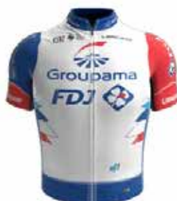
GROUPAMA - FDJ