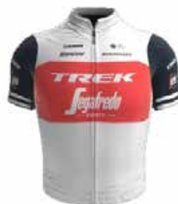
TREK - SEGAFREDO