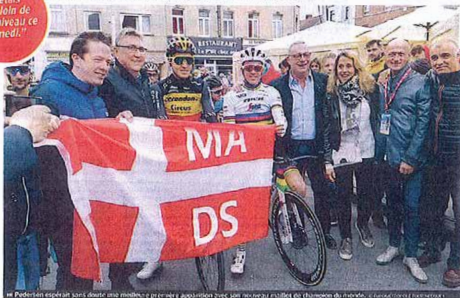
Pedersen espérait sans doute une meilleure première apparition avec son nouveau maillot de champion du monde.

« J'étais très loin de mon niveau ce samedi. »