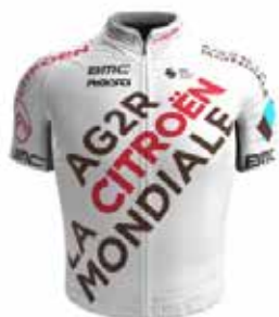
AG2R CITROËN TEAM

Pour cette édition du 29 septembre, il y a pour l'instant 11 équipes World Tour inscrites pour l'Eurométropole Tour .