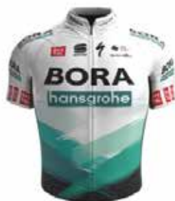
BORA - HANSGRÖHE