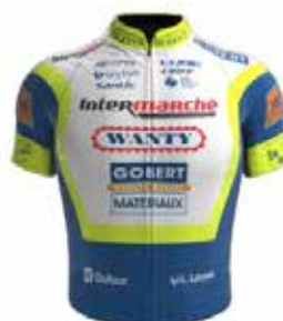
INTERMARCHÉ - WANTY - GOBERT MATÉRIAUX